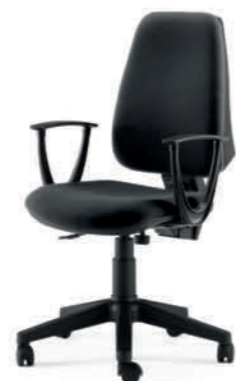
KIT5010 BRSON NERO