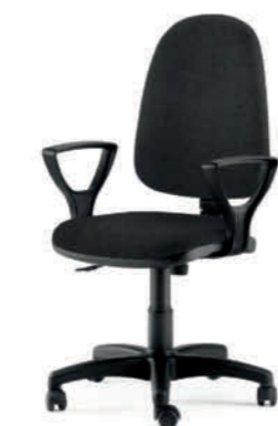
KIT100 BRGOLF NERO