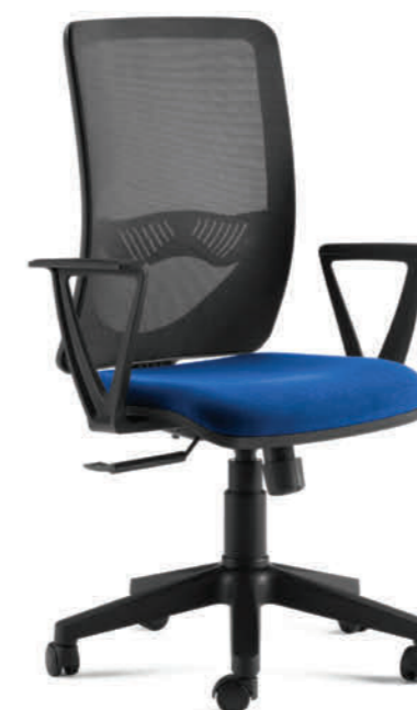
KIT96D BRTBL BLU

SEAT multilayer BACKREST polypropylene lined with black polyester mesh PADDING polyurethane foam seat 4 cm thick density 40 LUMBAR SUPPORT height-adjustable, polypropylene ARMRESTS BRTBL fixed, polypropylene. MECHANISM multi block synchro with shock-proof system LIFT gas pump (UNI 9084 Certified). CASTORS polyamide Ø 50 (AR1) SWIVEL BASE pyramid-shaped nylon (B9 ) ** KNOCK DOWN **