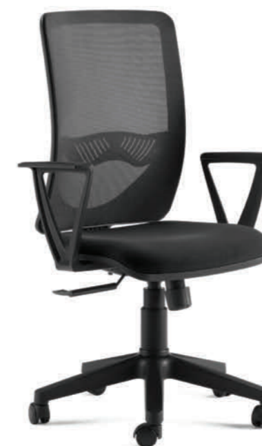
KIT96D BRTBL NERO