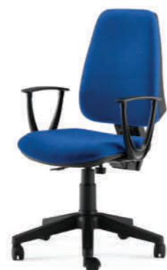
KIT5010 BRSON BLU