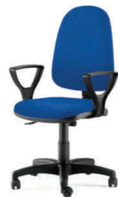
KIT100 BRGOLF BLU