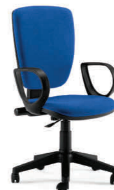
KIT401 BRJACK BLU