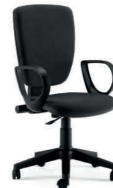
KIT401 BRJACK NERO

SEAT multilayer. BACKREST reinforced polypropylene. OUTER SHELL polypropylene. PADDING polyurethane foam cm 4 thick density 25/21. ARMRESTS BRJACK fixed, polypropylene. MECHANISM permanent contact mechanism height-adjustable backrest by up-down system. LIFT gas pump (UNI 9084 Certified). CASTORS polyamide Ø 50 mm. SWIVEL BASE B9 pyramid-shaped nylon base. ** KNOCKED DOWN **